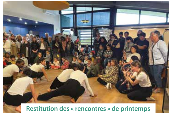
Restitution des « rencontres » de printemps à l'espace Nougaro