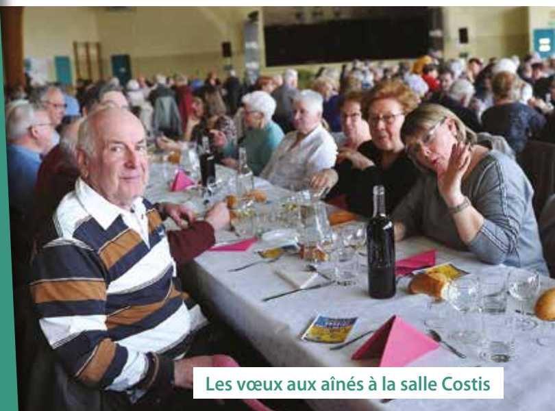
Les vœux aux aînés à la salle Costis