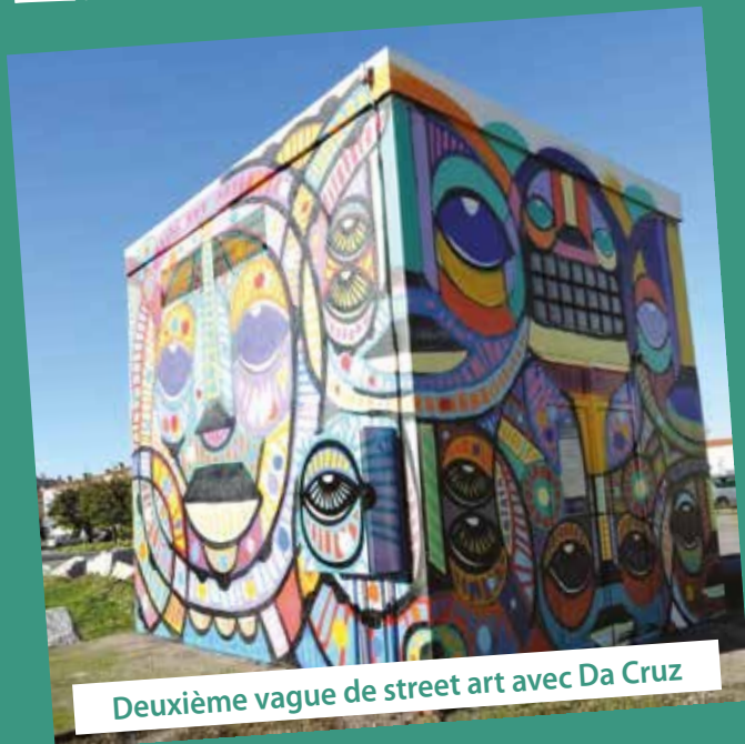
Deuxième vague de street art avec Da Cruz