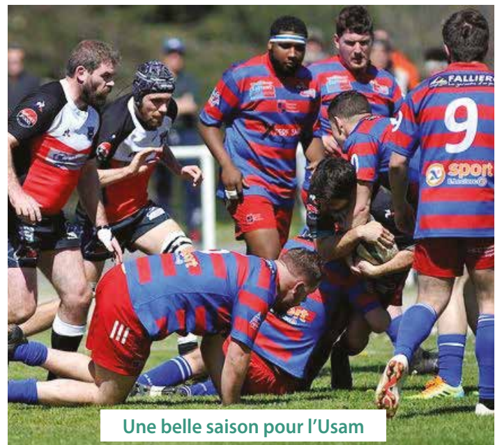
Une belle saison pour l'Usam