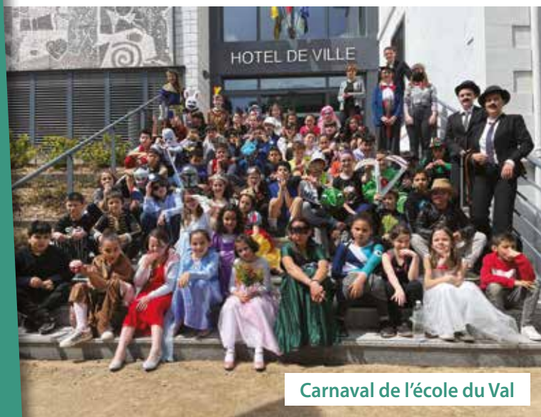
Carnaval de l'école du Val