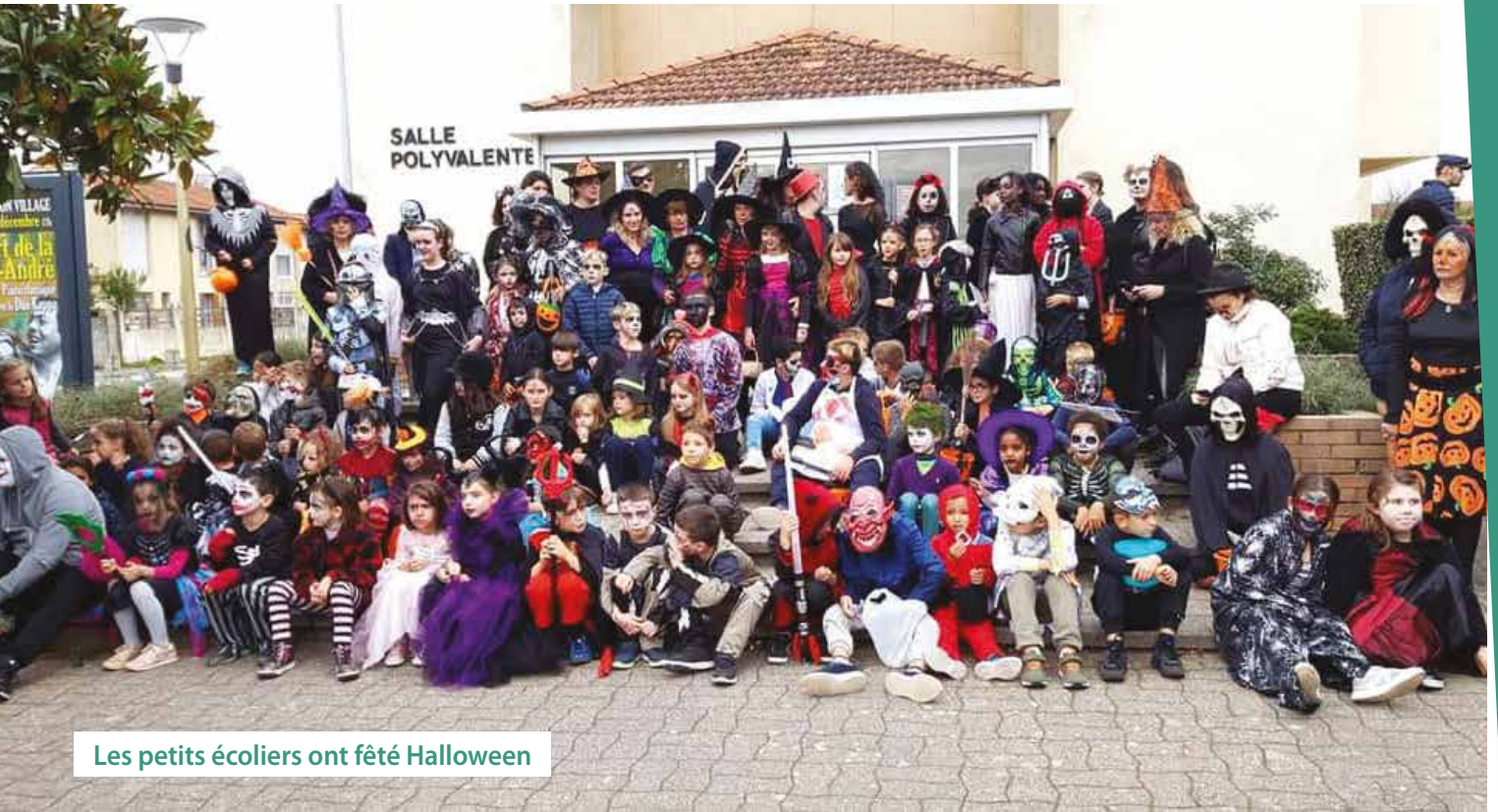
Les petits écoliers ont fêté Halloween