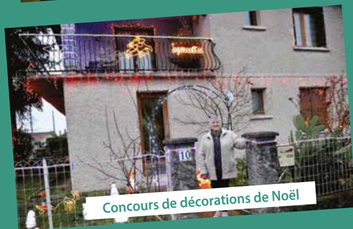
Concours de décorations de Noël