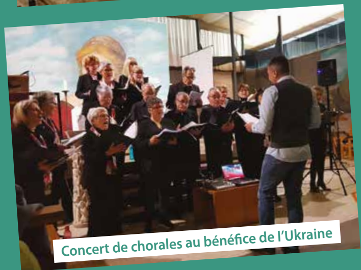
Concert de chorales au bénéfice de l'Ukraine